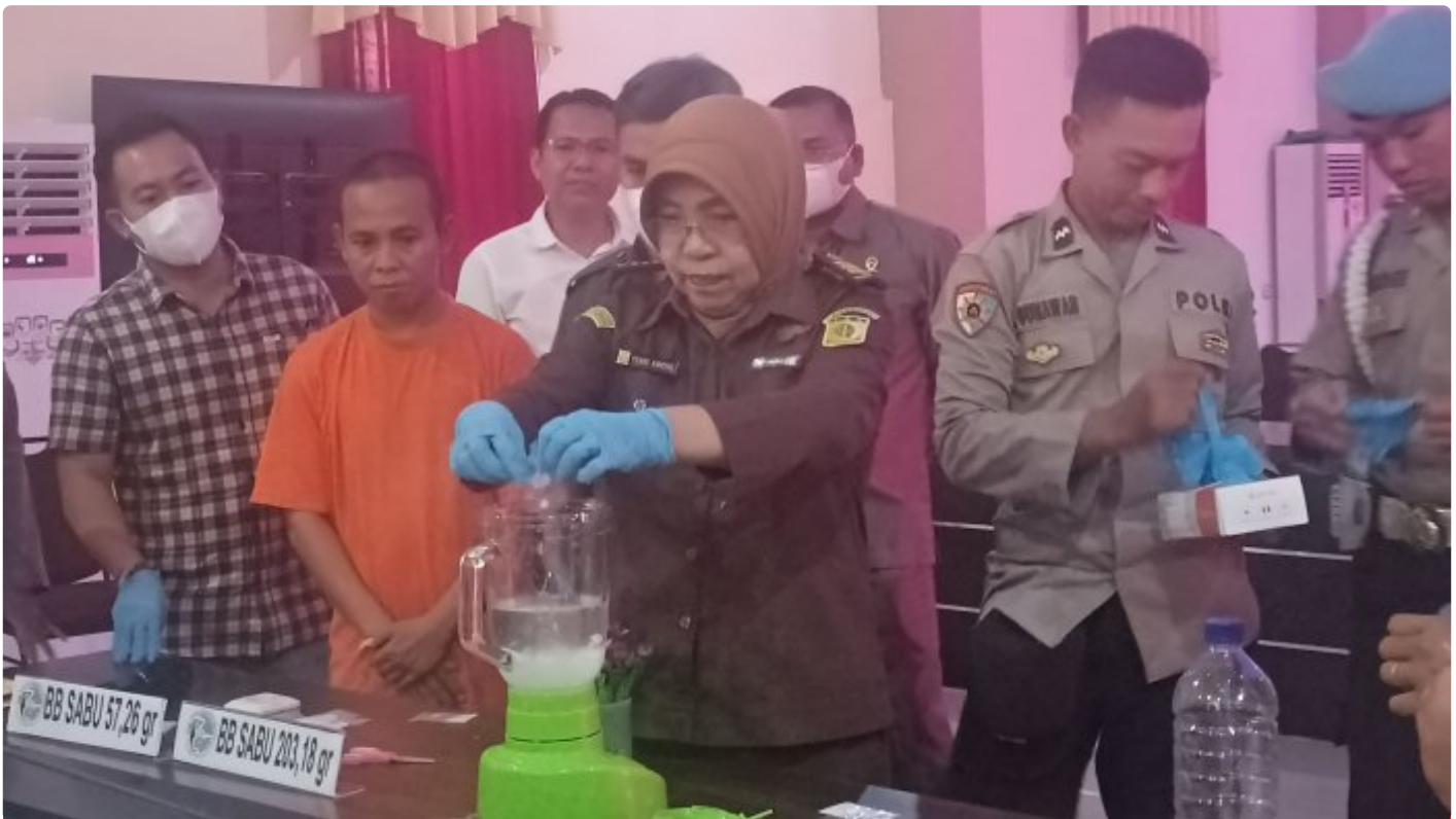
Proses Pemusnahan BB Sabu hasil Pengungkapan Sat Resnarkoba Polresta Mataram, (16/05/2023)

Matahari NTB - Menjalankan perintah UU, Polresta Mataram Melaksanakan Pemusnahan Barang Bukti Narkotika jenis Sabu hasil dari pengungkapan kasus oleh Sat Resnarkoba Polresta Mataram.